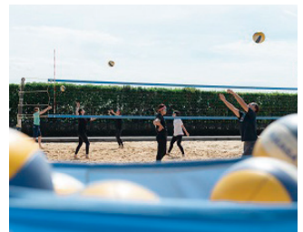
大学での練習風景