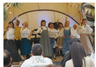
さんのう☆まじかる