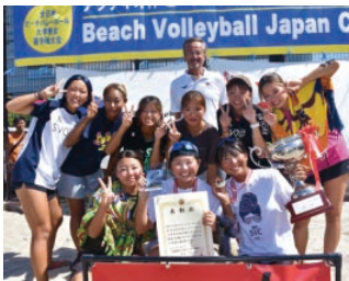
大学日本一4連覇達成の部員とコーチ