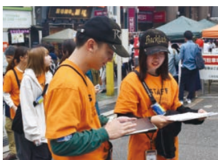
エンターテインメント・ラボ