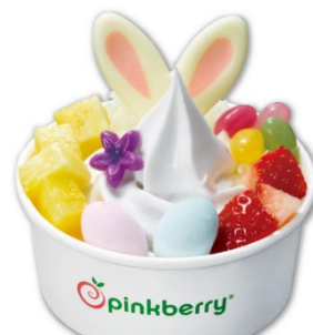
エッグハントで卵を見つけたイ スターラビットを表現

可愛いおしりはレモンのメレンゲ、足はマシュマロ。草原をイメージしたメロンの上のたまごはドラジェとグミで表現。お花のチョコレートも華やか。その他、好きなフルーツを2つ選べます。