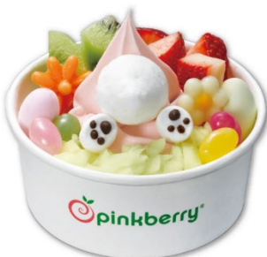
エッグハントをしている イースターラビットを表現