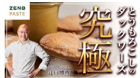
ZENB パーストを使用した とうもろこしのダックワーズ

※ZENB パーストとは普段食わずに捨てている皮や芯、種まで使ったまるごと野菜とオリーブオイルだけで作ったパースト。